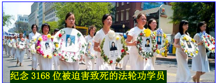
纪念 3168 位被迫害致死的法轮功学员