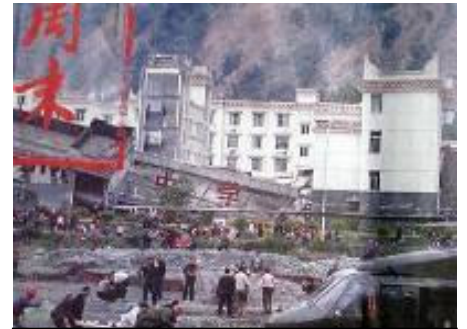
倒塌的中学后面露出了坚固豪华的办公楼

年前，克拉玛依发生火灾，“让领导先走”的命令使得几百个孩子被烧死、闷死，而领导们全逃脱了。现在中共依然是榨取人民的血汗，自己在豪华的房子里住和办公，孩子们在豆腐渣工程的危险楼里上课。共产党的唯一目的就是维持自己的统治，采用的是一贯的谎言和暴力。尽管目前共产党表面上也做出积极救灾的姿态，在媒体