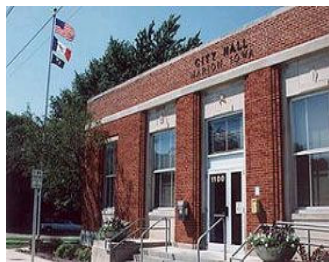
美国伊阿华州市政厅