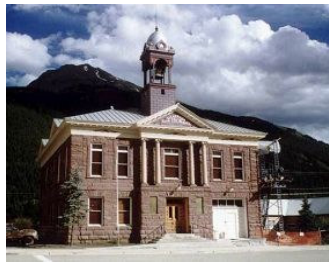
美国科罗拉多州市政厅