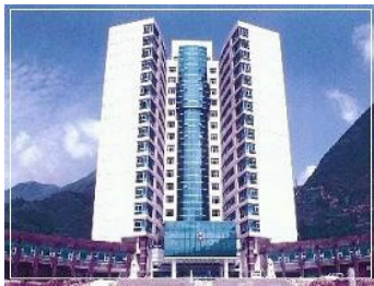
湖北兴山县政府楼