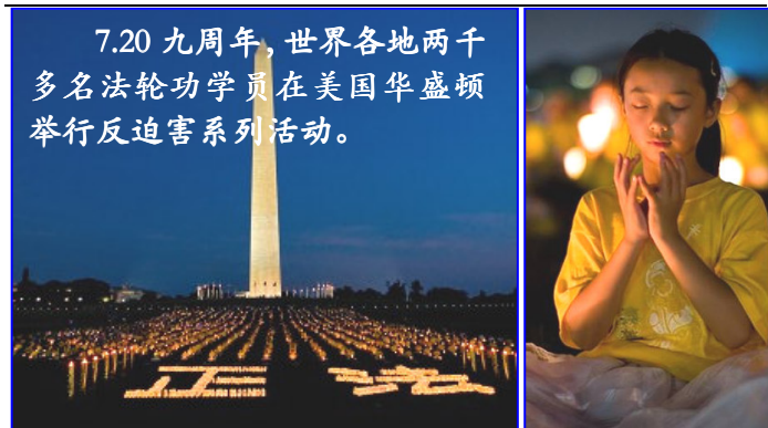
7.20 九周年，世界各地两千多名法轮功学员在美国华盛顿举行反迫害系列活动。