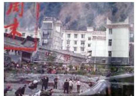
倒塌的中学后面露出了坚固豪华的办公楼

年前，克拉玛依发生火灾，“让领导先走”的命令使得几百个孩子被烧死、闷死，而领导们全逃脱了。现在中共依然是榨取人民的血汗，自己在豪华的房子里住和办公，孩子们在豆腐渣工程的危险楼里上课。共产党的唯一目的就是维持自己的统治，采用的是一贯的谎言和暴力。尽管目前共产党表面上也做出积极救灾的姿态，在媒体