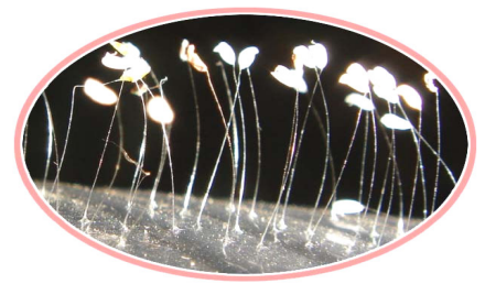
开在塑料杯上的优昙婆罗花

【明慧网】二零零八年五月十五日（农历四月十一），也就是法轮功学员们庆贺大法师父生日和世界法轮大法日的第三天，在湖北黄冈武穴市又出现优昙婆罗花。