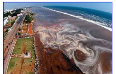
2004 年印度洋海啸，30 多万人丧生。海啸来临前，很多游客认为当地人的提醒扫了他们游玩的兴致。