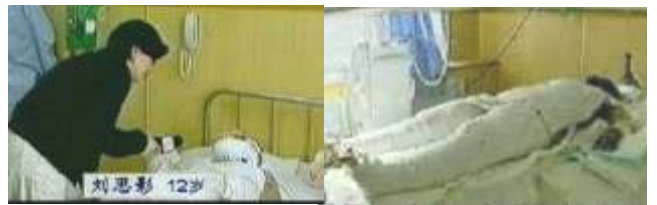
气管切开还能说、唱？记者采访不穿防护服，不戴口罩。