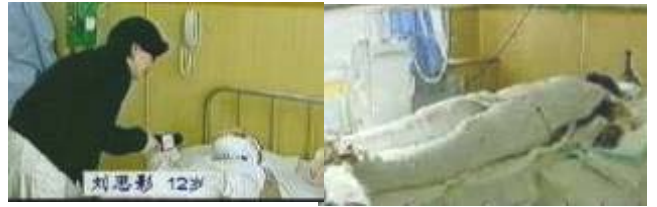
气管切开还能说、唱？记者采访不穿防护服，不戴口罩。

“藏字石”位于贵州省平塘县掌布风景区内的救星石景区，专家鉴定，500 年前一块 2.7 亿年的巨石从崖壁落下，落地一分为二。2002 年 6 月裂开的石头断面被当地人发现有一行汉字，这些汉字经三批国内专家鉴定，其结论为天然形成。而石头上