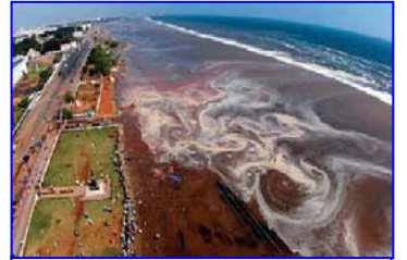
2004 年印度洋海啸，30 多万人丧生。海啸来临前，很多游客认为当地人的提醒扫了他们游玩的兴致。

很久很久以前，有一个村庄的人已经变得很坏了，人们几乎都不信佛了。天意就将毁了这个村庄。那时的地藏菩萨还想挽救有善心的人，想再给一个人一次机会，就幻化成一个要饭的，到村里挨家挨户的乞讨，寻找信佛的人。可没有人肯给一口饭吃。