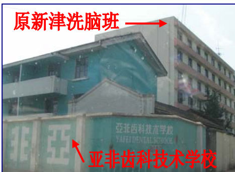
扩建后的新津洗脑班规模更为庞大

新津洗脑班是成都市委和四川省委，花费大约五百多万元，将原地处新津花桥蔡湾原某空军部队研究地改建而成。这里高墙外筑，高墙内使用酷刑迫害法轮功学员，甚至法轮功学员在这里被迫害致