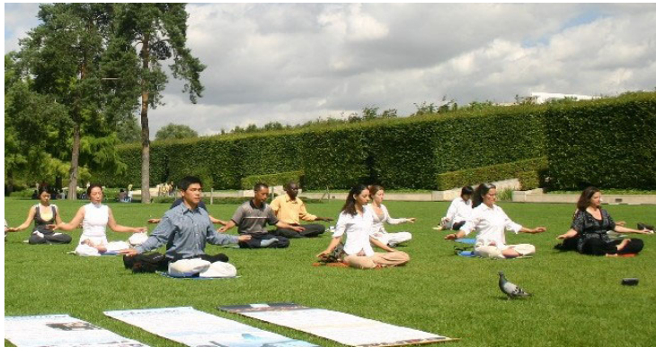
欧卫旁 André Citroën 公园里炼功的法轮功学员和揭露中共迫害的展板。

【明慧网二零零八年八月十三日】法国一家有影响力的二十四小时滚动新闻电视台 BFM TV 于二零零八年八月十二日播出节目，介绍法轮功，并揭露中共对法轮功的残酷迫害。