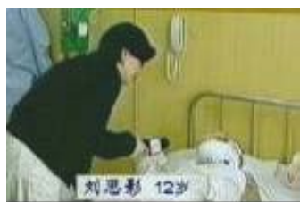
气管切开还能说、唱？记者采访不穿防护服、不戴口罩。