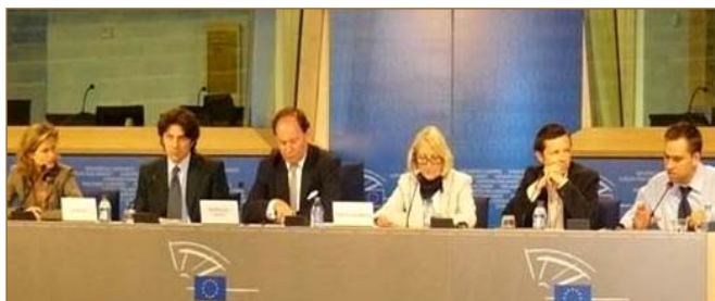
在记者无疆界组织针对此事的调查中，欧卫高层

二零零八年七月十五日，多个党派的欧洲议会议员在欧洲议会布鲁塞尔总部，与欧洲新唐人和记者无疆界、国际记者联盟等举行联合新闻发布会，强烈谴责欧卫在北京奥运前关闭新唐人的亚洲播出信号，要求欧盟和法国政府遵从欧洲人权、民主、法治的理念，敦促欧卫公司尽快恢复新唐人信号。