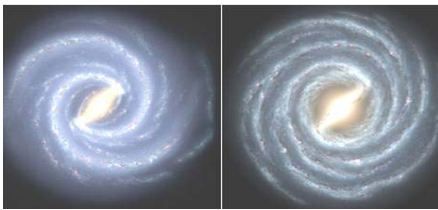
左边是银河系的目前结构 右边是较早的银河系图像

据美国太空网日前报导,几十年来,天文学家描绘的银河系有四条主要盘旋“臂膀”(就是