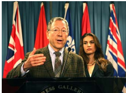
欧文·考特勒在新闻发布会上

【明慧网】二零零八年八月七日，加拿大国会议员，前司法部长欧文·考特勒在国会山召开新闻发布会，向媒体公布了一份名为“中国人权的侵犯——对奥运宪章与中共承诺的背叛”的人权报告，该报告列举了十一条