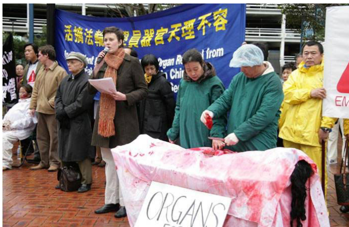
揭露中共活摘法轮功学员器官的模拟展示

所以当我听说从法轮功学员身上活摘器官时，我肯定这是真的，因为我不仅是一个医生，我还曾是一名中共的党员，我知道他们能做出任何令人难以置信的事情。法轮功学员在向人讲真相时被抓，没有人知道他的下落，他的家人也不知道，所以成了一个秘密，就好像这个人被蒸发了，所以把他们的器官取出贩卖，没人知道，而这个利益是巨大的，是无本的买卖。”