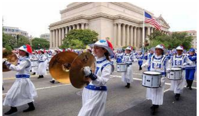
图：7月4日，法轮功天国乐团在美国首都国庆游行中

加首都独立日游行，从西海岸到东海岸，从北方到南方，几乎遍及美国各地。而只有二十多个乐队经评委