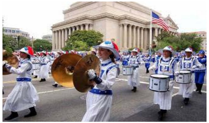
图：7月4日，法轮功天国乐团在美国首都国庆游行中

加首都独立日游行，从西海岸到东海岸，从北方到南方，几乎遍及美国各地。而只有二十多个乐队经评委