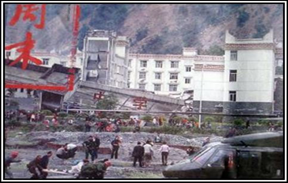
▲老旧灰暗的中学教学楼倒塌了，后面露出光亮气派的办公楼（四川省汶川县）

居民说：“水泥没有按正确比例与水混合。里面的钢筋也不够。沙子不干净。”“建教学楼用的都是些伪劣建材。”