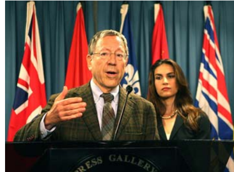
欧文·考特勒在新闻发布会上

【明慧网】二零零八年八月七日，加拿大国会议员，前司法部长欧文·考特勒在国会山召开新闻发布会，向媒体公布了一份名为