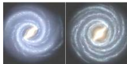
左边是银河系的目前结构 右边是较早的银河系图像