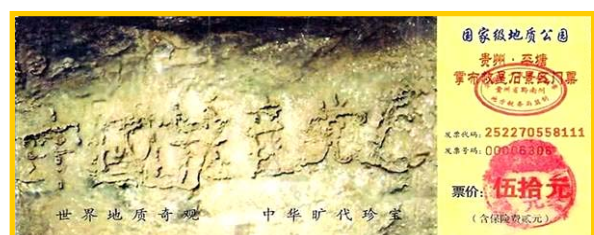
左图：贵州平塘县掌布风景区门票

法轮大法洪传世界，超越种族、国界，真修者无不身心受益，道德回升，这是全人类之福！