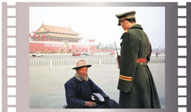
▲ 步行到天安门广场为法轮功和平请愿的老人