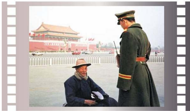
▲ 步行到天安门广场为法轮功和平请愿的老人