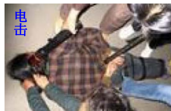
演示迫害大法弟子的酷刑