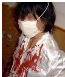
酷刑演示 戴芥末油口罩

上这种酷刑，邪党恶警一般选在半夜夜深人静的时候。他们先是把大法学员抓来后，锁进特制的铁椅子内，手反铐在背后，脚分别扣在两个半环扣在一起的圈里，双脚固定在一个位置不能动，在特制的地环内，全身动弹不得。恶警一般白天审讯的时候，威胁、恐吓、诱供，看问不出结果，就开始谩骂，一边谩骂一边说：“看我怎么收拾你”。然后派一个人或两个人专门看管大法学员，不让睡觉，不让闭眼。恶警们一般前半夜睡觉，半夜睡醒后，恶警们象地狱中的魔鬼一样，突然闯进来，然后不由分说揪住大法学员的头发后拽，他们一般三到四个人配合，先是迅速强行戴上浸满非常呛人、辛辣气味的芥末油口罩，令人胸闷异常，感觉要窒息一样，喘不上气来，鼻涕眼泪一起往下淌，然后捂住；或头上罩上抹了芥末油的塑料袋，封口直到窒息，不断重复；或往眼睛和鼻子的周围涂抹芥末油；或戴上口罩往里面倒辣椒油、芥末油。