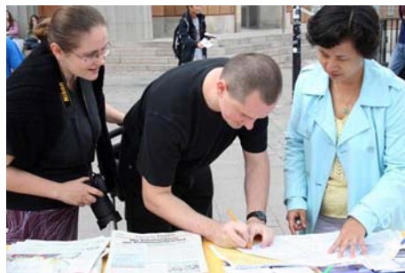
民众签名谴责中共迫害法轮功

希望能早日终止发生在中国的迫害，他们在支持制止中共迫害法轮功的征签簿上签下自己的名字，并对法轮功学员说的最多的就是：“我们能为你们做些什么？”◇