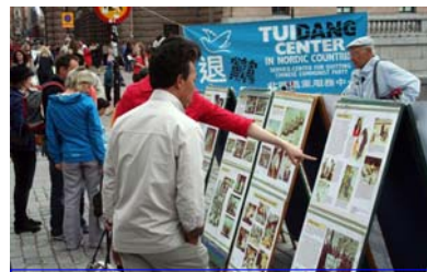
真相展板吸引民众关注

瑞典首都斯德哥尔摩的钱币广场 (Mynttorg) 上，来自世界各地的游客常是络绎不绝，当人们看到介绍法轮大法和揭露中共迫害法轮功学员的真相展板时，都