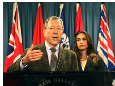
欧文·考特勒在新闻发布会上

【明慧网】二零零八年八月七日，加拿大国会议员，前司法部长欧文·考特勒在国会山召开新闻发布会，向媒体公布了一份名为“中国人权的侵犯——对奥运宪章与中共承诺的背叛”的人权报告，该报告列举了