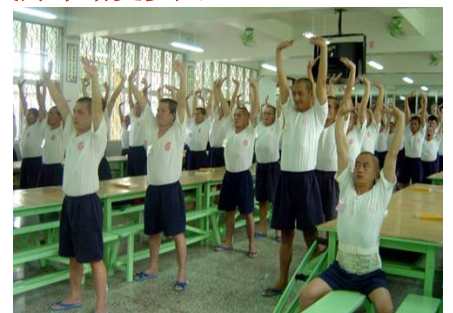
台湾多家监狱把学炼法轮功纳入教化课程。图为服刑人在炼功。

太太和我同时开始炼法轮功她也凡事努力做到先考虑别人，付出不计回报，所以与儿媳相处的很融洽。她原本很少出门，现在常到监狱教功。她说：“每个人都有善良的一