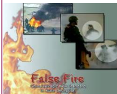
揭露自焚的影片《伪火》获第 51 届哥伦布国际电影节荣誉奖。