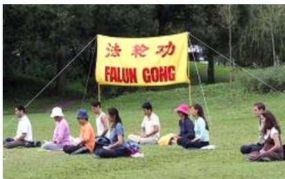
法轮功学员炼第五套功法