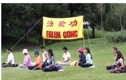
法轮功学员炼第五套功法