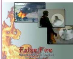
揭露自焚的影片《伪火》获第 51 届哥伦布国际电影节荣誉奖。