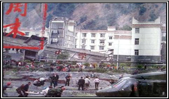
▲老旧灰暗的中学教学楼倒塌了，后面露出光亮气派的办公楼（四川省汶川县）

仅有一小部分学生被从废墟中抢救出来。该中学的四层教学楼垮塌并导致数百名学生死亡，而附近的楼房却依然站立着。居民说：“水泥没有按正确比例与水混合。里面的钢筋也不够。沙子不干净。”“建教学楼用的都是些伪劣建材。”