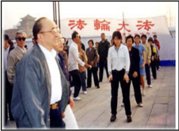
图为 98 年 5 月 15 日伍绍祖亲赴法轮功发祥地长春考察。

法轮功亦称法轮大法，是完整的一套性命双修的修炼方法。按照“真、善、忍”的标准修炼，除了修心还有五套功法用以修命。法轮功既是一种十分有效的健身功法，又是一种十分崇高的信仰。人们因修炼法轮功而无疾无病，人们因信仰“真、善、忍”而无私无恨。据中国协和医科大学副教授但凌等 11 位专家对北京市 12731 名法轮功学员的调查表明，其治病有效率达 99.1%；98 年 9 月，国家体育总局对广州等 10 个市约 1.25 万名法轮功学员就身心健康进行全面调查，祛病健身率达 97.9%。至 98 年，上海东方电视台统计中国有一亿人修炼法轮功。98 年下半年，以乔石为领导的全国人大组织详细调查，得出结论：法轮功于国于民有百利而无一害。◇