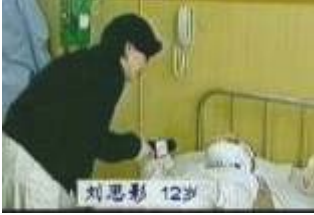
气管切开还能说、唱？记者采访不穿防护服不戴口罩。央视《焦点访谈》中的“自焚者”被包裹得严密。