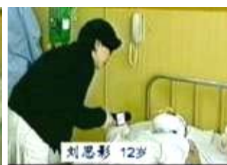
气管切开还能说唱？记者采访不穿防护服、不戴口罩。