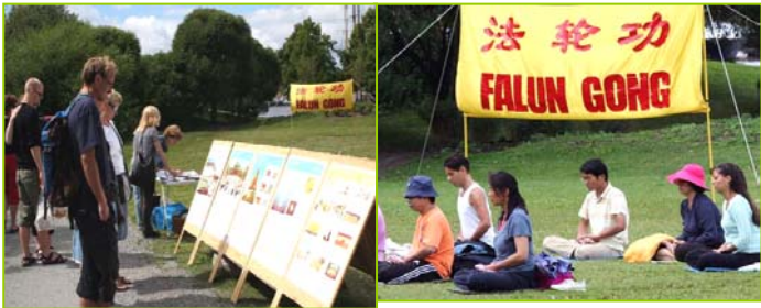
左图：来自世界各地的游客在展板前了解真相，然后到旁边签上自己的名字，表示支持法轮功、呼吁制止中共的迫害。右图：瑞典法轮功学员炼第五套功法。

他们早已了解了真相，但还是把所有的真相资料都拿全了，他们说：“我们看完了，会让宾馆里的其他中国人看。你们都不知道，这个真相材料在宾馆的中国人里传得可快哪！别看有的人不敢当众过来拿，其实他们都想看的。在国内上哪去看啊！”