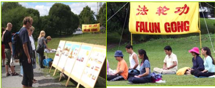
左图：来自世界各地的游客在展板前了解真相，然后到旁边签上自己的名字，表示支持法轮功、呼吁制止中共的迫害。右图：瑞典法轮功学员炼第五套功法。

他们早已了解了真相，但还是把所有的真相资料都拿全了，他们说：“我们看完了，会让宾馆里的其他中国人看。你们都不知道，这个真相材料在宾馆的中国人里传得可快哪！别看有的人不敢当众过来拿，其实他们都想看的。在国内上哪去看啊！”