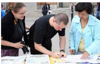
民众签名谴责中共迫害法轮功

瑞典首都斯德哥尔摩的钱币广场(Mynttorg)上，来自世界各国的游客常是络绎不绝，当人们看到介绍法轮大法和揭露中共迫害法轮功学员的真相展板时，都希望能早日终止发生在中国的迫