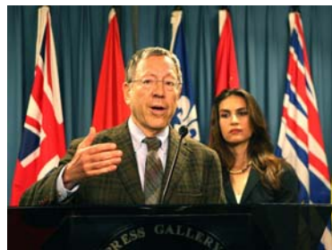
欧文·考特勒在新闻发布会上

【明慧网】二零零八年八月七日，加拿大国会议员，前司法部长欧文·考特勒在国会山召开新闻发布会，向媒体公布了一份名为“中国人权的侵犯---对奥运宪章与中共承诺的背叛”的人权报告，该报告列举了十一条中国正在发生的最典型的人权侵害。