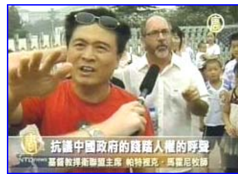
基督教捍卫联盟主席马霍尼牧师（中间西人）在天安门为法轮功发声

【明慧网】继八月六日在北京严密的保安监控下，出现多起外籍人士抗议中共压制自由的事件发生后，在奥运开幕的前一天，北京天安门广场附近再度出现抗议之声。三名美国人八月七日试图再次抗议中共钳制宗教自由，并提到为法轮功修炼者发声，随后被中共便衣警察拽走。