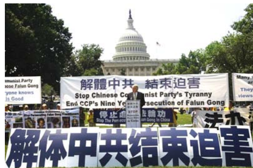
来自世界多国的 2000 多名法轮功学员在美国华盛顿举行活动，呼吁制止中共对法轮功长达九年的迫害。

为什么天要灭中共呢？因为中共独裁统治几十年来，一直采取强制洗脑、欺骗宣传、暴力镇压民众。它为一己之私利发动大大小小的各种名目的政治运动，整死、害死了我们骨肉同胞八