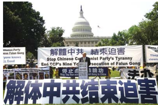
来自世界多国的 2000 多名法轮功学员在美国华盛顿举行活动，呼吁制止中共对法轮功长达九年的迫害。

为什么天要灭中共呢？因为中共独裁统治几十年来，一直采取强制洗脑、欺骗宣传、暴力镇压民众。它为一己之私利发动大大小小的各种名目的政治运动，整死、害死了我们骨肉同胞八