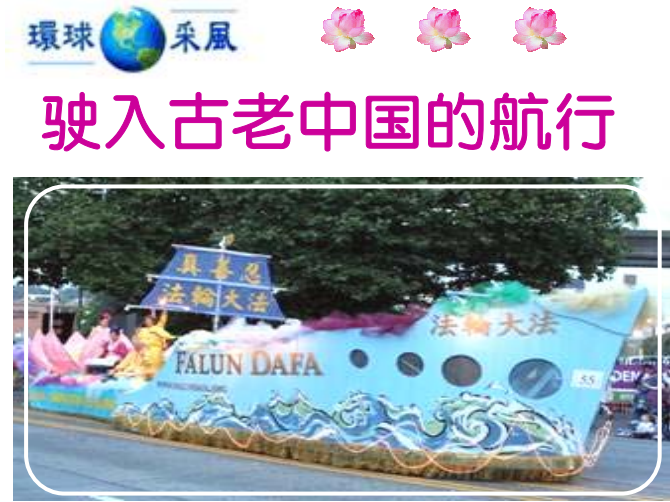
【明慧网】七月二十六日晚，美国西雅图第五十九届海洋节“炬光”大游行吸引了三十万现

凭、假商品……人们已经不知道什么东西可以相信了；在几十年“你死我活”的政治斗争中，曾经夫妻反目、父子相残，人们为了自保已经把“人人见面有戒心”、你争我夺、尔虞我诈当作了常态，也造成了社会上紧张的人际关系。要想完全改变这种不正确的状态，唯一的出路就是让我们整个民族脱离党文化的思想控制，回归“仁义礼智信”的传统道德理念。◇