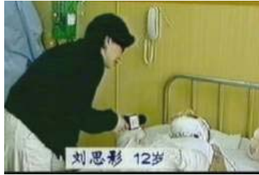
气管切开还能说、唱？记者采访不穿防护服，不戴口罩？

注：国际教育发展组织（IED）二零零一年八月在联合国会议上的正式声明指出：中共企图以今年一月二十三日天安门广场上的自焚事件来诬陷法轮功。我们得到一份录像分析表明，整个事件是由政府一手导演的。