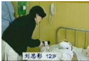
气管切开还能说、唱？记者采访不穿防护服，不戴口罩？

注：国际教育发展组织（IED）二零零一年八月在联合国会议上的正式声明指出：中共企图以今年一月二十三日天安门广场上的自焚事件来诬陷法轮功。我们得到一份录像分析表明，整个事件是由政府一手导演的。