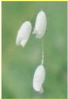
优昙婆罗花 放大图

有一天女儿推过来一辆自行车，说是车子上长着优昙婆罗花。之前，女儿给他拿来过有关优昙婆罗花的资料，他还特意查过辞海、词源，也让小孙子在电脑上给他搜索过有关优昙婆罗花的资料。他拿着放大镜看了半天，心里知道这花的神奇，可是话一出口却说成：“优昙婆罗花不是这样的，佛经