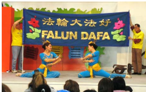
▲法轮功学员表演舞蹈“花仙”

【明慧网】澳洲昆士兰一年一度规模最为庞大的布里斯本皇家博览会于二零零八年八月登场。昆士兰法轮功学员连续第三年应邀参加了表演。为期十天的博览会是当地居民每年最为期待的盛大活动之一。在人山人海的会馆里，学员们为观众展示了法轮功功法，此外，他们还精心准备了舞狮表演和中华传统舞蹈与澳洲民众分享。