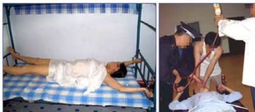
▲大陆劳教所、监狱的酷刑图示：绑死人床、下囓子、野蛮灌食，这些法轮功学员面临生命危险。

此次北京奥运，邪党草木皆兵，为防各国来京记者调查，早将京城劳教所内关押的法轮功学员秘密押送外地。据近期明慧网曝光出的消息，那些坚定的学员被秘送到山西、内蒙及辽宁省的马三家劳教所。引人注意的是：作为奥运比赛城市的沈阳市，马三家劳