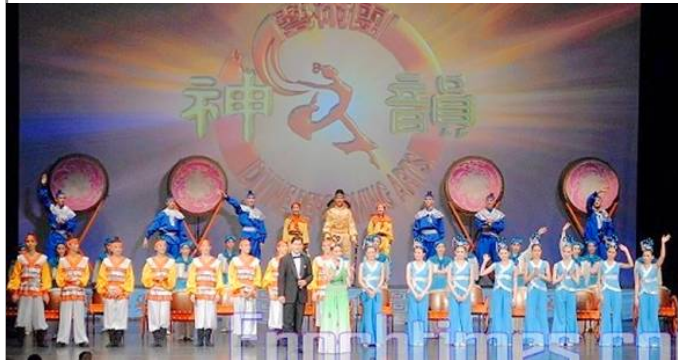
“神韵晚会”美国新泽西州上演 观众盛赞