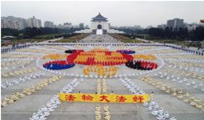
2005 年 12 月 25 日台湾 4000 名法轮功学员组成的轮图形 7