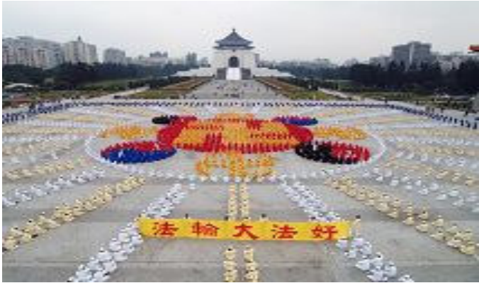
2005 年 12 月 25 日台湾 4000 名法轮功学员组成的轮图形 7

由和人权的标语，会比参观景点的任何风光更有价值，因为这是中国难得一见的景致，也是台湾自由民主价值之所在。