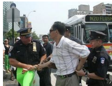
美国警察逮捕谩骂法轮功学员的中共暴徒。

但法拉盛暴力事件已引起国际社会的关注，尤其是中共纽约总领事彭克玉得意忘形，受命中共策动法拉盛围攻活动的录音曝光后，人们通过正与邪、善与恶的鲜明对照，看清了中共的邪恶本质。