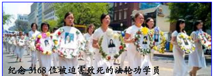
纪念3168位被迫害致死的法轮功学员