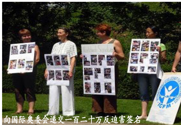
向国际奥委会递交一百二十万反迫害签名

强大的国际压力下，欧卫当时放弃了停止新唐人合同的企图。新唐人电视台是大陆人唯一能接收到外界真实信息的独立中文电视台，很多民众从中了解到真实的资讯，如：《九评共产党》系列片、非典疫情、迫害法轮功、四川地震、法拉盛红色恐怖等。“新唐人”真实的报道，使中共的谎言败露，中共一直不择手段威逼利诱欧卫公司放弃原则。◇