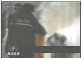
3、手摸被打后的头部