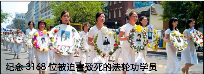
纪念 3168 位被迫害致死的法轮功学员