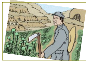
南泥湾“大生产运动”，实际上是非法种鸦片的运动。

另外，中共大肆宣传的南泥湾“大生产运动”，实际上是非法种鸦片的运动。《九评》揭出了中共在陕北南泥湾种罂粟，张思德因烤制毒品被砸死这一史实。其实，种毒、制毒、贩毒的罪恶勾当在中共的各占领区蔓延普及，中共种植罂粟、制作毒品贩卖，换取经费以招兵买马，那是千真万确的事实。