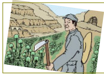
南泥湾“大生产运动”，实际上是非法种鸦片的运动。

另外，中共大肆宣传的南泥湾“大生产运动”，实际上是非法种鸦片的运动。《九评》揭出了中共在陕北南泥湾种罂粟，张思德因烤制毒品被砸死这一史实。其实，种毒、制毒、贩毒的罪恶勾当在中共的各占领区蔓延普及，中共种植罂粟、制作毒品贩卖，换取经费以招兵买马，那是千真万确的事实。