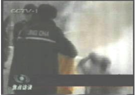
3、手摸被打后的头部