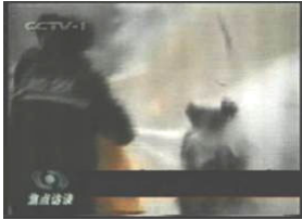
2、击打后飞出的重物