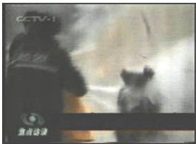
2、击打后飞出的重物