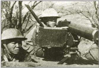
国军将士在台儿庄外围阻击进犯的日军

说共产党“假抗日、真内战”，我深有体会。中共宣称是它领导全国人民打败了日本人。但是，大量史料爆出中共有意不参与当时的抗日战争，并趁国民党抗战之际，积蓄力量，拖抗日战争的后腿。共产党高举抗日大旗，却只在后方收编地方军和游击队，除了平型关等几个屈指可数的对日战斗外，共产党无抗日战绩可言，只是在忙于扩大地盘，在日本投降时抢着受降日军。当时我的家乡属于沦陷区，中共叫“敌后”，八路军的一支部队在那驻扎七年，后来