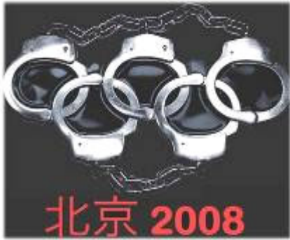
▲中共对外打着“反对把奥运政治化”的幌子，对内却借机加剧人权迫害，使奥运沦为名副其实的“手铐奥运”。

◆河北、山西省缺水的农民们也被中共划入另一个世界。河北连续十一年干旱，零七年冬至今，已有五千万亩耕地大旱，二十五万人饮水困难；山西人均水资源量仅为全国人均水平的 17%，本来就属于极度缺水地区。然而因为奥运，两省已经连续向北京大规模输水五次，并且还将在零八年向北京输水三亿立方米，为的是“将中心地区换上干净的环保面容，呈现给奥运游客”。