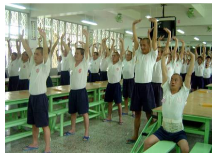
台湾多家监狱把学炼法轮功纳入教化课程。图为服刑人在炼功。

在三十多年来担任法官的生涯中，我看到犯罪率年年攀升，犯罪手法日益凶残，道德沉沦，风气败坏。而法轮大法真正能拯救人心，台湾许多犯人在狱