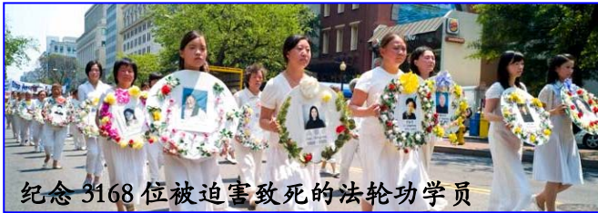
纪念 3168 位被迫害致死的法轮功学员