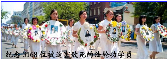
纪念 3168 位被迫害致死的法轮功学员