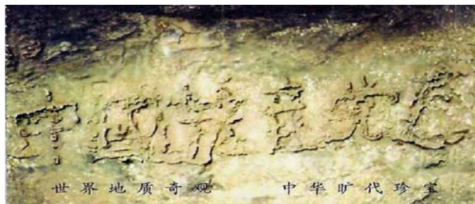
（图为：贵州藏字石，上网可搜到）

古有“亡秦碑”，今有“藏字石”，都是神在向人传达着天意。法轮功学员告诉人们“天要灭中共，退党保平安”，并不是在诅咒中共，只是把这个天意传达给人，使善良的人早日退出党、团、队组织，免遭厄运。