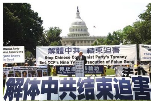
来自世界多国的 2000 多名法轮功学员在美国华盛顿举行活动，呼吁制止中共对法轮功长达九年的迫害。