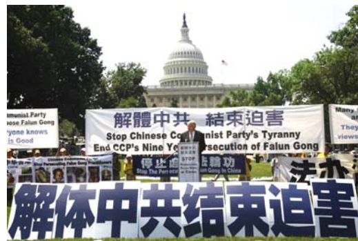
来自世界多国的 2000 多名法轮功学员在美国华盛顿举行活动，呼吁制止中共对法轮功长达九年的迫害。

轮功，只是从电视、广播里听到中共的蒙骗宣传、诬陷歪曲的一面之词，就在心里盲目的仇恨、敌视法轮功，如果因此而做出参与迫害法轮功学员的坏事，以致对你的将来带来恶果，这对你自己来说是不公平的。