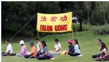
法轮功学员炼第五套功法

【明慧网】二零零八年八月十日，当看到在瑞典斯德哥尔摩著名的旅游景点瓦萨沉船博物馆（Vasa museet）旁集体炼功的法轮功学员时，一对来自中国大陆的老年夫妇感叹道：“真的是哪里都有法轮功啊！”