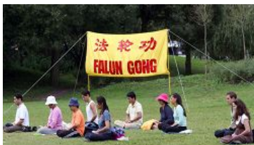
法轮功学员炼第五套功法

【明慧网】二零零八年八月十日，当看到在瑞典斯德哥尔摩著名的旅游景点瓦萨沉船博物馆（Vasa museet）旁集体炼功的法轮功学员时，一对来自中国大陆的老年夫妇感叹道：“真的是哪里都有法轮功啊！”