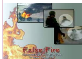
揭露自焚的影片《伪火》获第51届哥伦布国际电影节荣誉奖。