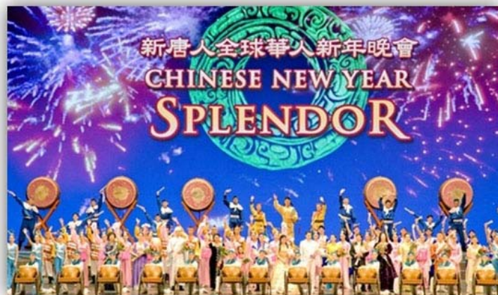
■ 2008 年神韵在纽约无线电城音乐厅演出的盛大场面

最后谢佩蓉说：“我们重视每场演出、每一位观众，希望每个观众都能真正了解神韵传递出的中华五千年文化精华，不要错过这个机缘。文化是一个民族的根。我们以祖先传下来的深厚文化而自豪，也为神韵能将这些宝贵的财富承传到未来而骄傲。”◇