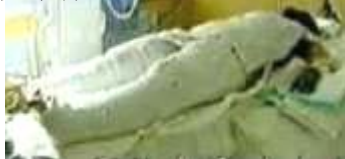
央视《焦点访谈》中的“自焚者”被包裹得严密。

国际教育发展组织(IED)二零零一年八月在联合国会议上的正式声明指出：中共企图以天安门广场上的自焚事件来诬陷法轮功。我们得到一份录像分析表明，整个事件是由政府一手导演的。