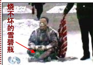
中央电视台“天安门自焚事件”的画面