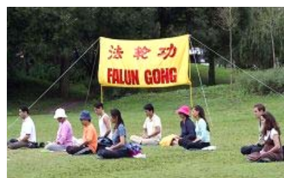
法轮功学员炼第五套功法

很显然他们早已了解了真相，但今天还是把所有的真相资料都拿全了，并对学员说：“你们这些资