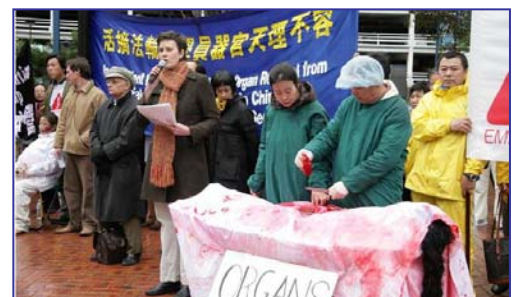
▲揭露中共活摘法轮功学员器官模拟展