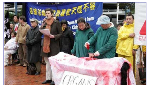
▲揭露中共活摘法轮功学员器官模拟展