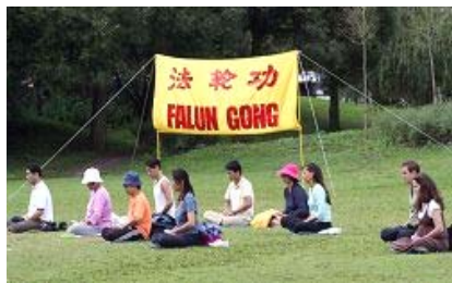
法轮功学员炼第五套功法

【明慧网】二零零八年八月十日，当看到在瑞典斯德哥尔摩著名的旅游景点瓦萨沉船博物馆（Vasa museet）旁集体炼功的法轮功学员时，一对来自中国大陆的老年夫妇感叹道：“真的是哪里都有法轮功啊！”