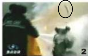
2、击打后飞出的重物