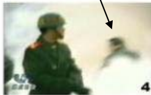
3、击打刘头部的手臂 4、击打者仍保持用力姿势

美国华盛顿邮报记者菲力蒲·潘(Phillip Pan)亲自到刘春玲的家乡开封实地调查，邻居们说从来没有人看见过刘春玲练法轮功，而且刘春玲不是开封本地人，生前在夜总会靠陪吃陪舞谋生。