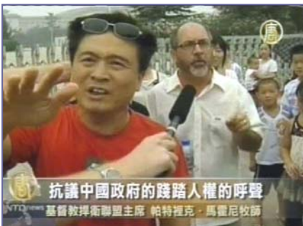
“基督教捍卫联盟主席”马霍尼牧师(中间的白衣者)在天安门为法轮功呼吁,中共便衣阻挡。