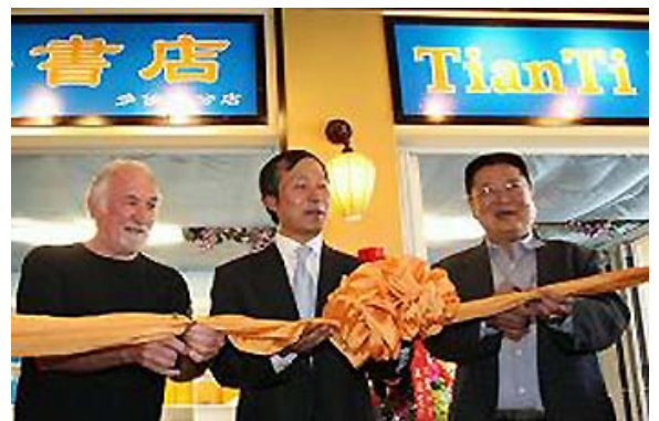
多伦多中区唐人街的“天梯书店”开张

法轮大法的主要著作《转法轮》、《法轮功》已被翻译成三十多种语言并在世界各地出版发行；还有更多语种的翻译正在进行过程之中；目前世界上有八十多个国家和地区有法轮功修炼者。