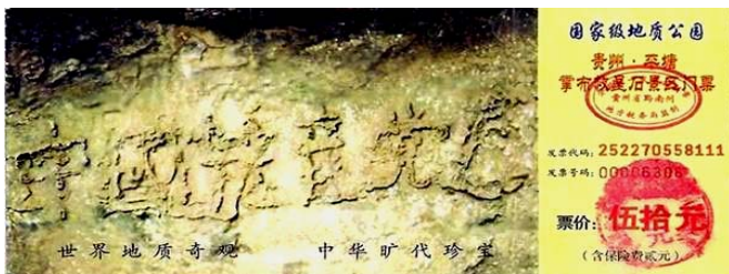
贵州省平塘县掌布乡风景区门票：中国共产党亡