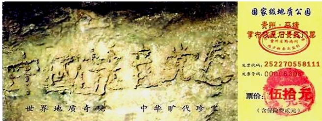
贵州省平塘县掌布乡风景区门票：中国共产党亡