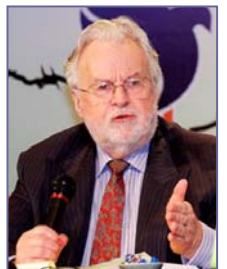
安世立大律师，现为“法轮功受迫害真相联合调查团”北美分团团长。

真正中立的立场，不是闭上眼睛、塞上耳朵。更不是在听了一面之词、受了谎言蒙蔽之后，出于对此话题的偏见、害怕，而故意回避。