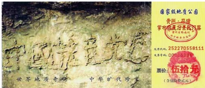
贵州省平塘县掌布乡风景区门票

2002年6月，在贵州省平塘县掌布乡风景区发现了距今2.7亿岁的“藏字石”，巨石断面惊现六个大字：“ 中國共產党亡 ”。经专家考证未发现人工雕凿痕迹，CCTV曾经有过专题报道，央视十套2004年8月2日20:30播出的《走进科学》就是专题片《揭秘“藏字石”》。国内一百多家媒体都有过报道与专题，但都隐去“亡”字。仔细看，你会看到门票图片中的第六个字：亡。天灭中共，这不仅是苍生之愿，也是即将到来的现实！