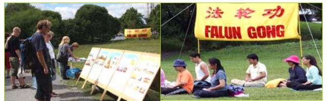
左图：来自世界各地的游客在展板前了解真相，然后到旁边签上自己的名字，表示支持法轮功、呼吁制止中共的迫害。右图：瑞典法轮功学员炼第五套功法。

原来他们夫妇二人去过美国、加拿大、澳洲，还有英国，都见到过法轮功学员。这次老两口是头一次来瑞典，又遇到了法轮功，所以挺高兴。他们还说：“原来我们只是听说很多国家都有炼法轮功的，这回真是眼见为实啊！走到哪儿就见到哪。而且很多都是外国人。我就说嘛，这功肯定对身体有益的。”