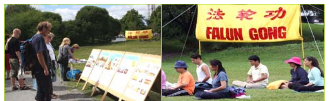
左图：来自世界各地的游客在展板前了解真相，然后到旁边签上自己的名字，表示支持法轮功、呼吁制止中共的迫害。右图：瑞典法轮功学员炼第五套功法。

原来他们夫妇二人去过美国、加拿大、澳洲，还有英国，都见到过法轮功学员。这次老两口是头一次来瑞典，又遇到了法轮功，所以挺高兴。他们还说：“原来我们只是听说很多国家都有炼法轮功的，这回真是眼见为实啊！走到哪儿就见到哪。而且很多都是外国人。我就说嘛，这功肯定对身体有益的。”